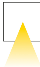
fascio singolo single beam